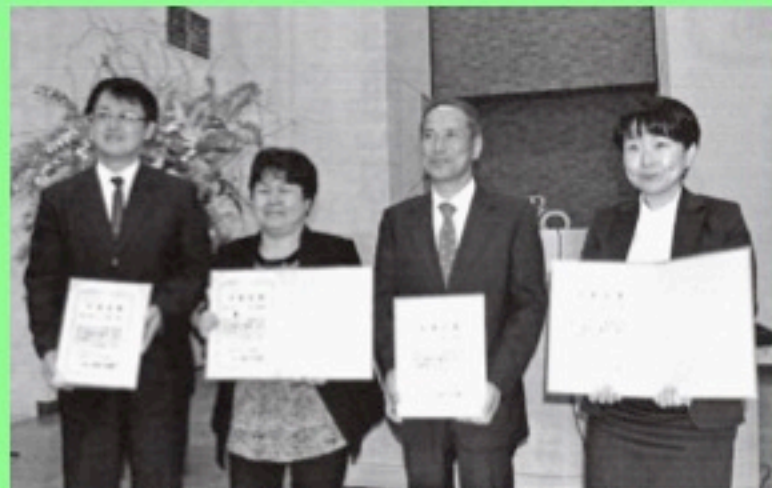
左から稲川兄、安楽姉、河野兄、間村姉