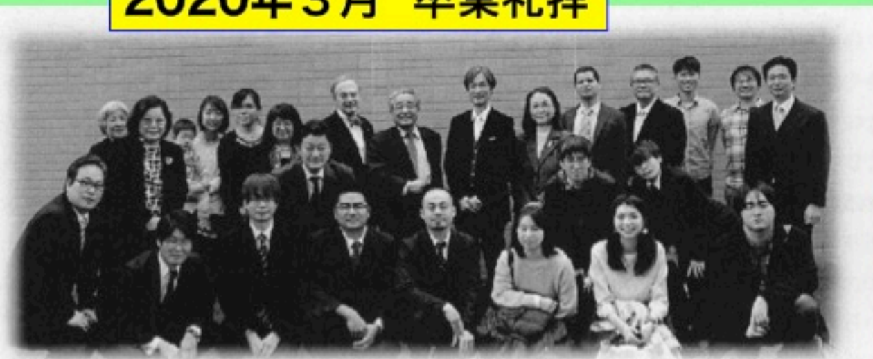
2019年度 西南学院大学神学部及び大学院神学研究科卒業礼拝 (2020年3月18日 於：西南学院大学神学寮)